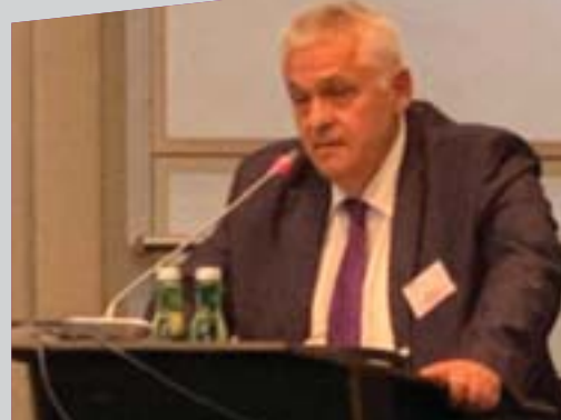
Выступление В.С. Овчинского на конференции ОБСЕ «Искусственный интеллект и полиция». Вена, 23 сентября 2019 г.

Почему Чезаре Ломброзо так ненавидели в СССР? В своей гениальной работе «Анархисты» он описал типы революционных деятелей как аномальных людей. Некоторые советские вожди увидели себя в этой книге и предали Ломброзо анафеме.