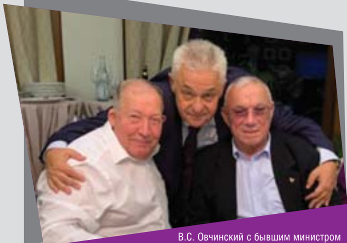
В.С. Овчинский с бывшим министром внутренних дел РФ А.С. Куликовым и заместителем министра внутренних дел РФ В.Н. Кирьяновым

В США высок уровень электронного контроля за обществом — действует система «Призма» (это то же, что и система социального рейтинга).