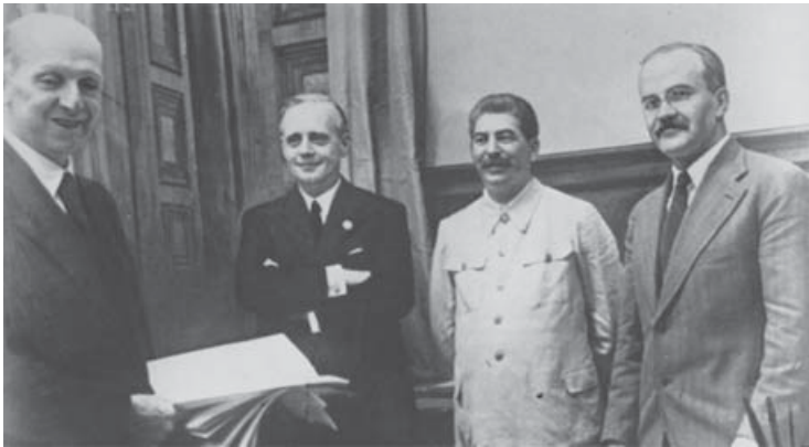
Пакт Молотова — Риббентропа. Москва, 23 августа 1939 г.

До 22 июня 1941 г. Гитлер мог быть для нас как угодно злодеем, но он был главой великой державы, с которой можно и нужно было выстраи-