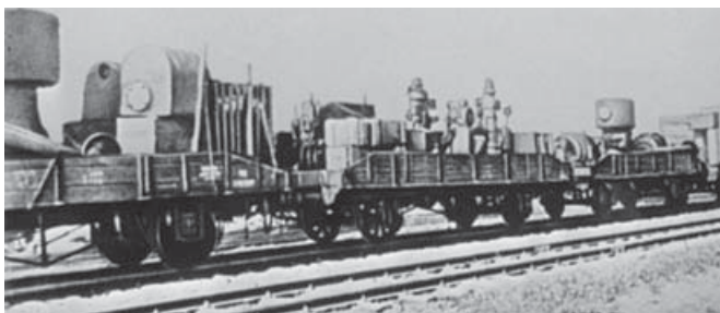
Эвакуация промышленного оборудования железнодорожным транспортом

➤➤ Благодаря эвакуации военной промышленности мы не только победили в войне, но и получили новый огромный промышленный комплекс в Сибири и на Урале, который и сегодня остается главной экономической базой страны.