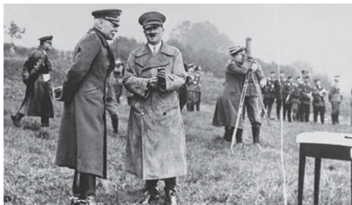
Адольф Гитлер и генерал фон Сект наблюдают за маневрами немецкой армии. Германия, 2 октября 1936 г.

исключить появление новой Антанты и войны на два фронта, он 21 августа одновременно направил предложение Лондону принять Геринга, чтобы тот встретился с Чемберленом с целью урегулирования разногласий на англо-германских переговорах, а Москве — предложение принять Риббентропа, который должен был прийти, чтобы подписать пакт о ненападении. Согласием ответили обе столицы. Гитлер выбрал Москву, отменив визит Геринга в Лондон, поскольку подобный пакт Соединенное Королевство подписало еще 30 сентября 1938 г. В книге «Утраченное время. Как начиналась Вторая мировая война» английский военный писатель и историк Леонард Мосли пишет: «В английской столице 23 августа Невилл Чемберлен и лорд Галифакс