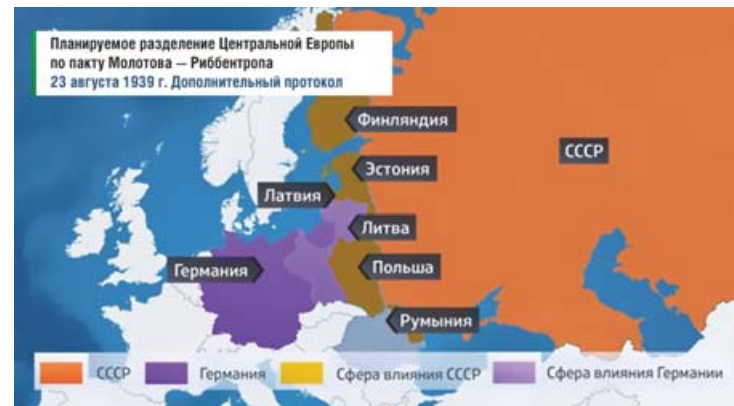
Планируемое разделение Центральной Европы по пакту Молотова — Риббентропа

В 1939 г. было принято решение о строительстве предприятий-дублеров. С 1939 по 1941 г. на Урале и в Сибири было построено более 2000 производственных площадок с подведенными коммуникациями в целях подготовки эвакуации предприятий из европейской части СССР на случай войны. Это, кстати, тоже полностью развенчивает миф о «доверчивом и наивном» Сталине, который поверил Гитлеру после подписания пакта Риббентропа — Молотова и думал, что Германия не нападет на нашу страну.