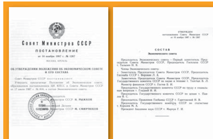
Документы Экономического совета

И особое место в этом периоде премьер выделял текущему 1990 году. Именно тогда предстояло создать основы преодоления кризисных явлений. Был обещан « крупный структурный маневр ». Ускорение темпов роста рассчитывали достигнуть почти полностью за счет роста потребительского сектора экономики при одновременной стабилизации, а в ряде случаев