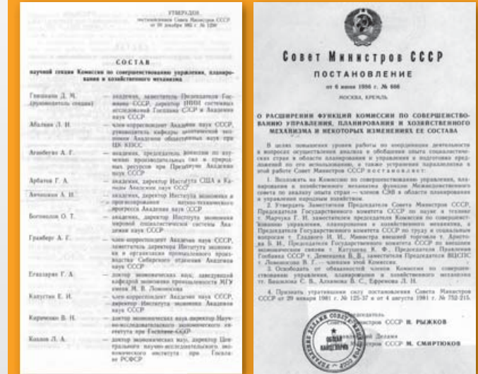
Документы Комиссии по совершенствованию управления планирования и хозяйственного механизма

использовать тот огромный капитал, который мы накопили за годы советской власти. Имею в виду и научно-технический, и весь интеллектуальный потенциал нашего общества, и те огромные ресурсы, которыми надо с каждым днем распоряжаться все более умело, чтобы обеспечить достойную жизнь и нынешних поколений, и будущих. <...>