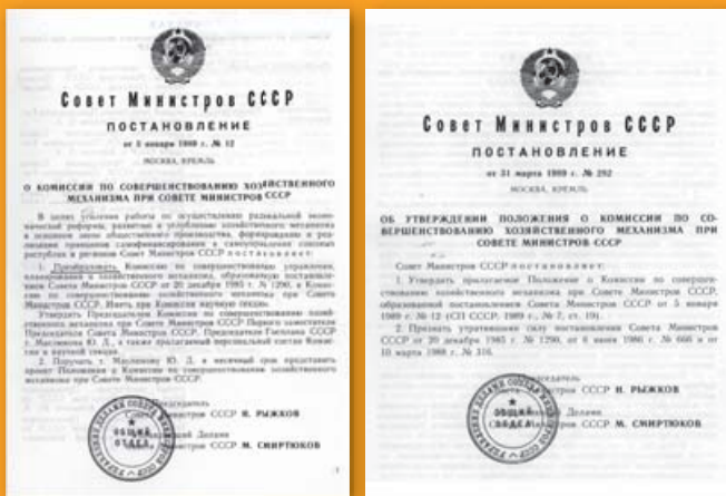
Документы Комиссии по совершенствованию хозяйственного механизма при Совете Министров СССР

необоснованных доходов, выпуску в обращение денег, не обеспеченных соответствующей товарной массой».