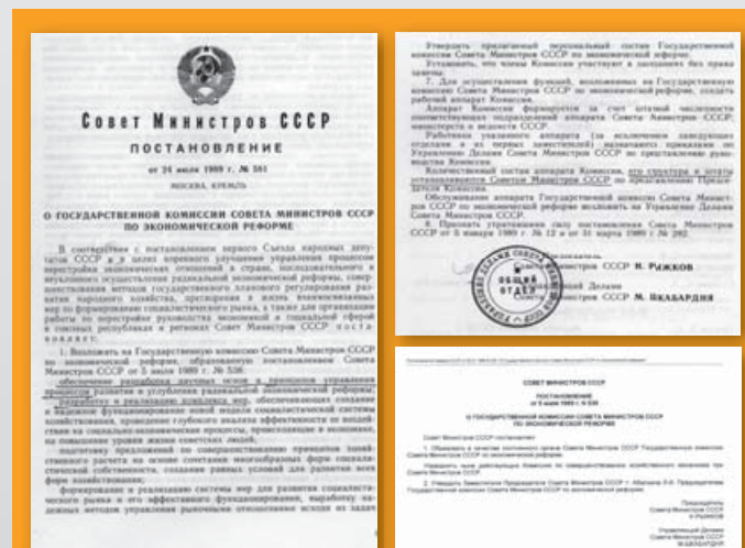
Документы Государственной комиссии Совета Министров СССР по экономической реформе