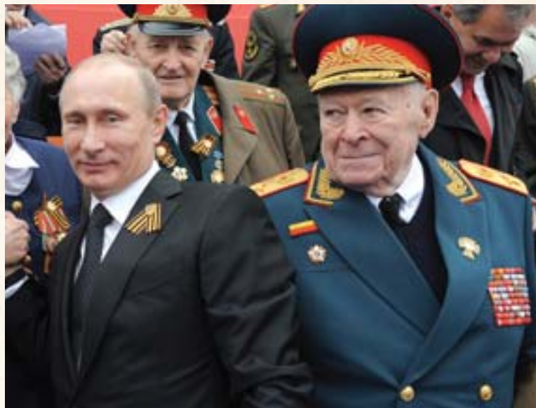
В.В. Путин и Ф.Д. Бобков

Фрагмент интервью: «В 1980 году Чубайс и его друзья вступили в Совет молодых ученых Ленинградского инженерно-экономического института, а в 1981 году Чубайс (член парткома ЛИЭИ) этот Совет возглавил и стал подыскивать молодых экономистов из других ленинградских вузов для участия в обсуждении экономических проблем. Под крышей Совета молодых ученых образовался своеобразный „экономический кружок“, стали совершенно открыто проводиться семинары, на которых обсуждалось „как улучшить хозяйственный механизм социализма“. <...> И, наконец, самое главное: когда Андропов стал Генеральным секретарем ЦК КПСС, в самом конце его