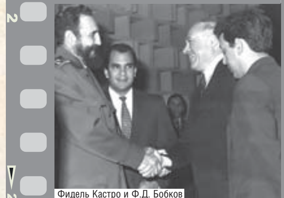
Фидель Кастро и Ф.Д. Бобков