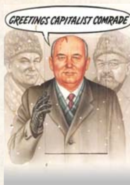
Почтовая открытка. США, апрель 1990 г. Лицевая сторона (справа): «День рождения капиталиста-компрадора». Обратная сторона (слева): «От коммунистической партии зверей»