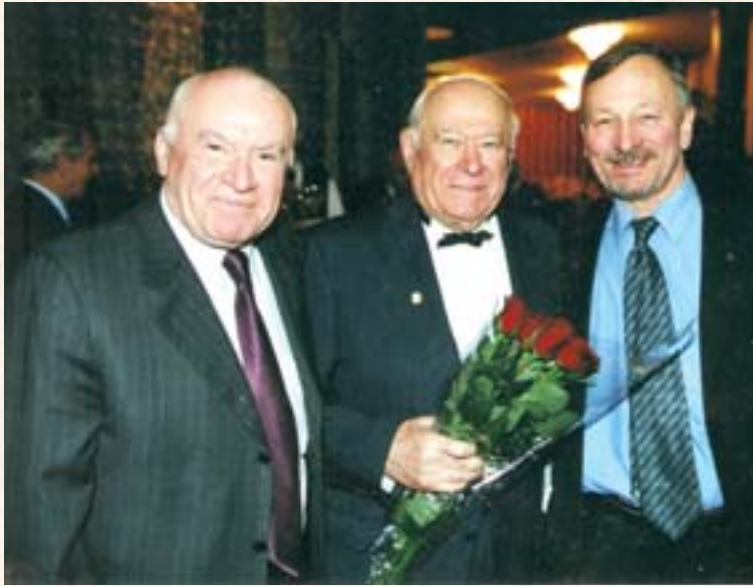
Л.А. Бокерия, Ф.Д. Бобков, С.Ю. Рыбас

Конфиденциальная информация: куратор института ИАША от КГБ майор Икс был разоблачен как агент иностранной разведки, осужден и расстрелян.